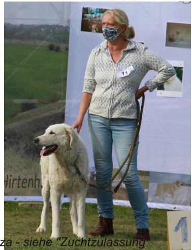
Majna-menti Mákvirág Csusza - siehe "Zuchtzulassung"