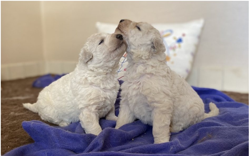
Apollo & Ariane von Neuzenbrunnen mit 2 Wochen

Alle hier genannten Ausstellungen können auch mit dem sog. neutralen Meldeschein gemeldet werden. Diesen erhalten Sie, sofern Sie kein Internet-Nutzer sind, bei unserer Leiterin der Geschäftsstelle Frau Schulz. Im Internet finden Sie den neutralen Meldeschein zum Ausdrucken unter: www.vdh.de/ausstellungen/neutraler_meldeschein.php